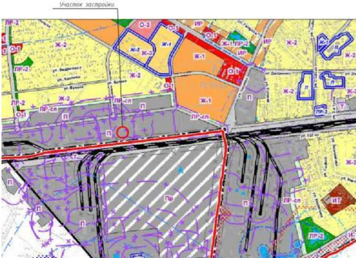
СХЕМА ИНЖЕНЕРНО-ТЕХНИЧЕСКОГО ОБЕСПЕЧЕНИЯ ЗЕМЕЛЬНОГО УЧАСТКА М 1:1000